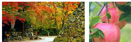
小諸・懐古園の紅葉とりんご狩り